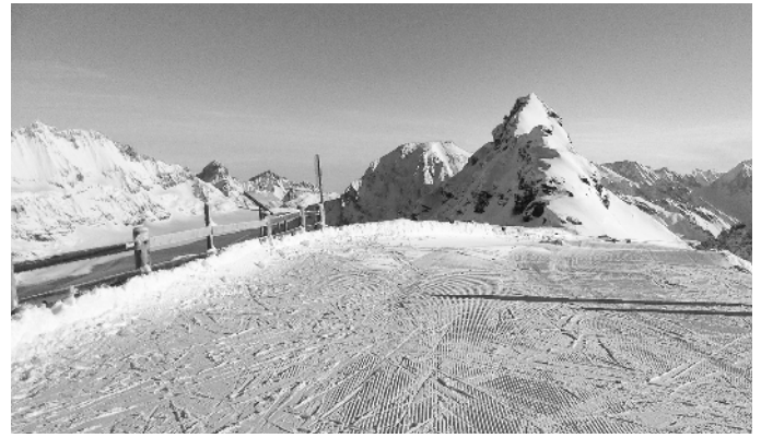
Die Pisten waren super und so verging der Tag sehr schnell. Abendessen im Bietschhorn wie immer Spitze.