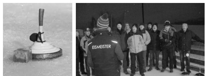
Daube und Eisstock

In den Sportferien sind die Turnhallen geschlossen. Deshalb wagte sich die Männerriege als Turnersatz auf's Glatteis. 18 Männerturner fanden sich um 18.00 Uhr auf der Eisbahn Hirzenfeld ein, um sich im Eisstockschiessen zu messen.