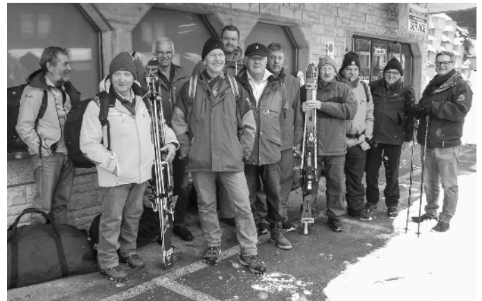
Dieses Jahr hat die Reservation der BLS geklappt. Ein schönes Skiwochenende ging sehr schnell und unfallfrei vorbei. Das nächste Skiweekend findet vom 31. Januar – 2. Februar 2020 statt.