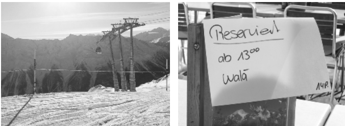
Mit der Gondelbahn hinauf und ab auf die Pisten, die Fussgänger wanderten natürlich zu Fuss auf die Lauchernalp. Mittagspause in der Bergsunna.